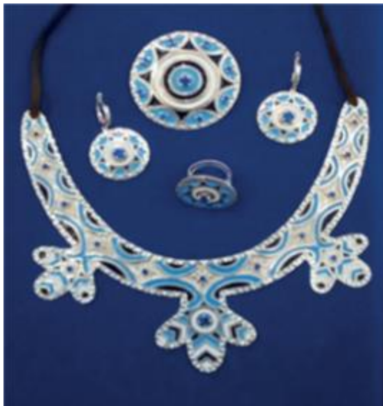
Рисунок 3. Проект национального украшения эвенков «Иманра»

Культурные традиции народов севера в настоящее время интерпретируются не только современными графическими дизайнерами. В своей работе по изучению декоративно-прикладного искусства эвенков Сидорова Л.Е. [5] предложила проект этнодизайна национальных украшений (рис. 3). Автор применяет традиционные техники и характерные культурные мотивы.