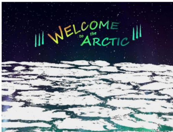
Рисунок 1. Полиграфическая иллюстрация «Welcome to the Arctic»

Как было сказано выше, проблема популяризации Арктики является одной из актуальных на данный момент. Для того, чтобы привлечь внимание к этому региону нашей страны, поднять его популярность среди туристов, применяются различные маркетинговые способы. Реклама неизменно включает в себя какие-либо графические элементы. Вдохновение для создания креативных изделий дизайнеры России в свою очередь черпают из традиционной культуры народов Арктики, а также образов природы и животных Севера.