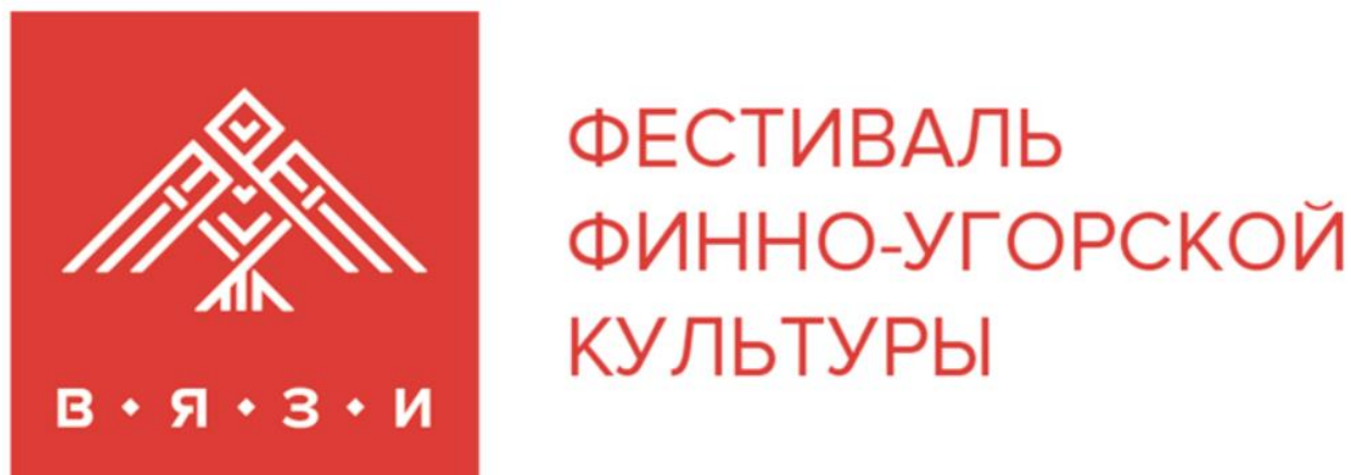
Рисунок 5. Логотип фестиваля Финно-угорской культуры «Вязи»

Этнические мотивы можно встретить во множестве современных работ. Изабель Ретамосо Рохас 7 при разработке фирменного стиля для фестиваля Финно-угорской культуры опиралась на традиционные орнаментальные техники, чтобы отразить бережное отношение народа к своим традициям. Образ, зашифрованный в логотипе, также является частью мифологии (рис.5).