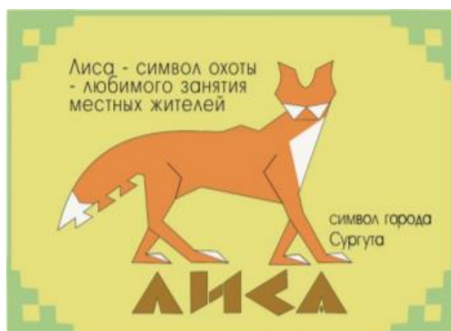
Рисунок 2. Открытка «Птицы и животные Югры. Лиса»

Говоря о вдохновении, нельзя не упомянуть выполнение современных графических изображений в стилистике традиционного искусства народов севера. А.В. Иващенко разработала концепцию набора сувенирных открыток «Птицы и животные Югры» [7]. Автор предлагает не фотографии с достопримечательностями города, а интересные стилизованные образы животных, являющихся символами той или иной местности (рис.2).