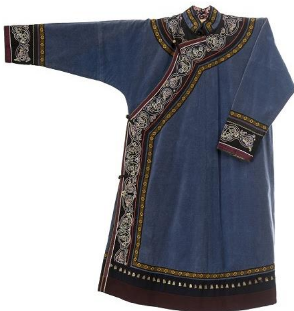
Рисунок 1. Праздничный ульчский халат [8]

По количеству узоров и их исполнению можно определить не только назначения халата, но еще и пол и возраст его владельца. Часто встречались вышивки птиц, оленей, рыб. Чередование цветов повышало декоративное достоинство работы.