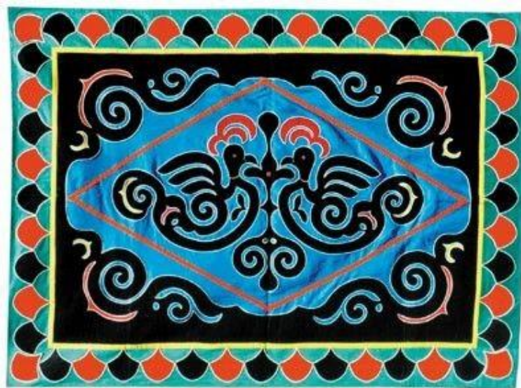
Рисунок 2. Т.М. Еюка. Хабаровская выставка 2000 г., ковер «Птицы» [8]

Сейчас ковры ульчи создают из ситца и сатины. Используются техники вышивки и аппликации. Кроме того, ныне их отличает лаконизм.