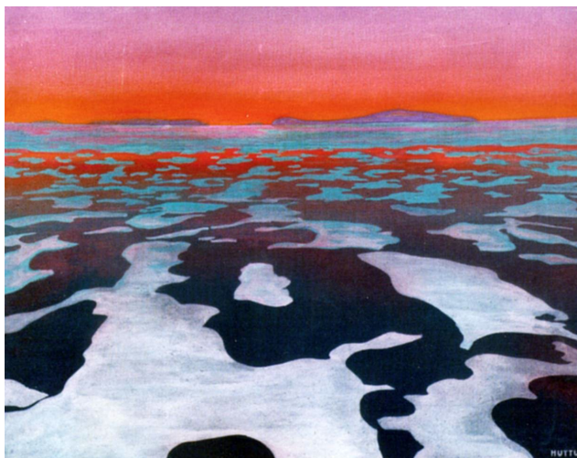
Рис. 5. «Летний вечер у архипелага Норденшельда», 1898 г. 5