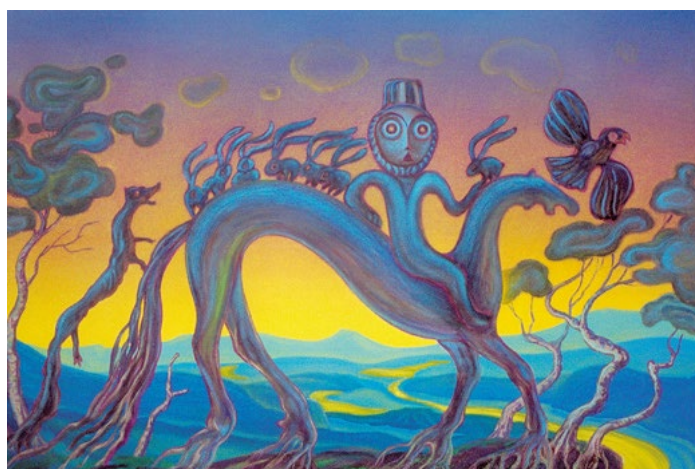
Рисунок. 4. Работа Арви Хуттунена 4

Некоторые произведения живописца несут также и философский, метафорический смысл. Часть работ художника описывает мифические сюжеты, затрагивает саамский и русский фольклор. Есть ряд работ политической направленности. Однако их не такое большое количество: абсолютное большинство произведений сосредоточено все же на природе Севера (Рис.4)