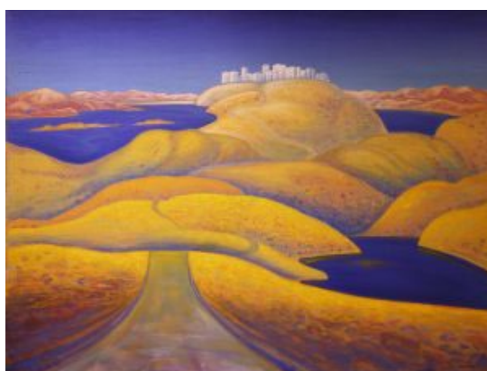
Рисунок. 3. Осень в Заполярье. 2003. 3

«Каждая его персональная выставка — яркое событие в культурной жизни региона» [9] (Рис.3)