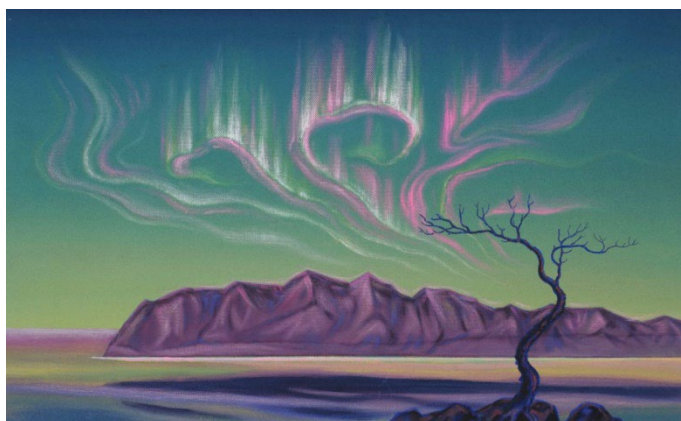
Рисунок. 2. Хуттунен А. И. Северное сияние. Вторая половина XX века 2

Суммарно за всю жизнь Арви Хуттунен принял участие более, чем в ста выставках. Проходили они как в России (областного, регионального, республиканского, всесоюзного, всероссийского и международного уровней), так и за границей (В Финляндии и Норвегии в 1970 и 1971 годах в рамках выставки «Произведения мурманских художников»). Он ни раз выставлялся в Мурманске, Архангельске, Петрозаводске, Вологде, Сыктывкаре, Кирове, Москве и других городах. Его первые персональные выставки состоялись как раз в столице Заполярья, которую он так любил. Проходили они начиная с 1970 года. (Рис. 2).