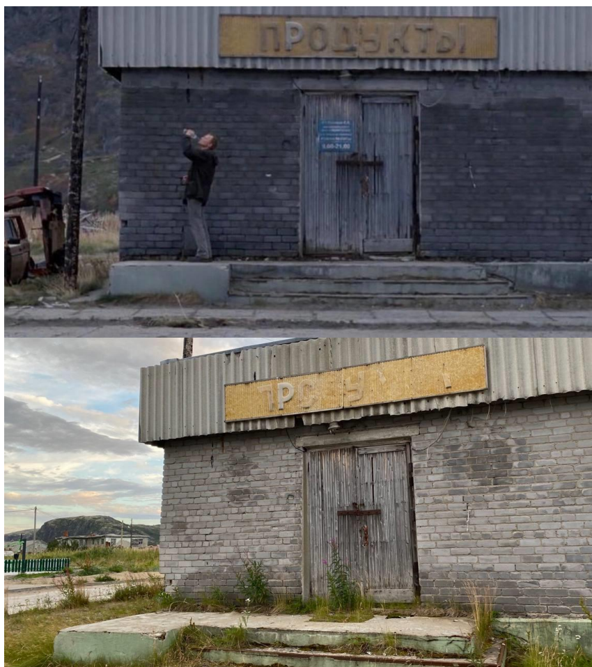
Рисунок 1. Заброшенный продуктовый магазин из фильма “Левиафан” как пример ассоциативного культурного ландшафта.

Туристическая деятельность может стимулироваться познавательными турами для наблюдения за явлениями Полярного дня и Полярной ночи, неизвестными большинству россиян, уникальными птичьими базарами на берегу Баренцева моря, посещением эстетически ценных природных ландшафтов береговой зоны и речной долины р. Териберка (рис. 2).