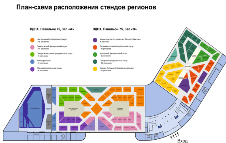
Рисунок 7. План-схема расположения стендов регионов 10

Конечно же, вы также можете ознакомиться с экспозициями регионов Арктической зоны Российской Федерации (Рисунок 7). В прикреплённой ниже карте представлено местонахождение стендов Мурманской области и Чукотского автономного округа, чтобы гости смогли окунуться в визуальную атмосферу особенностей регионов и ознакомиться с культурой северных народов.