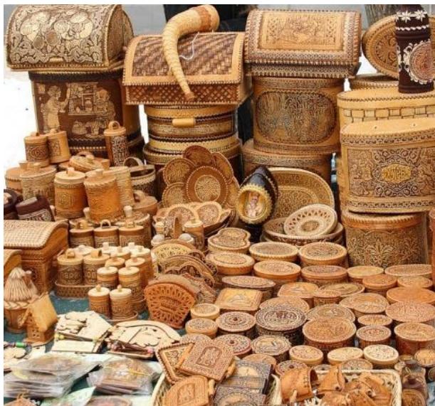
Рисунок 5. Изделия, выполненные из бересты

Саамские мастера умело создают предметы обихода из бересты: посуда, колыбели, покрытия для жилища (Рисунок 5). При бережном уходе, предметы, сделанные из бересты, которые не пропускают влагу, прослужат нескольким поколениям [6].