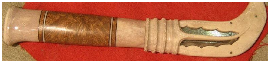
Рисунок 2. Саамский нож 3

Искусство народов, проживающих в суровых условиях по истине уникально. Саамские умельцы используют кости оленей для создания рукоятей ножей и ножен. Используя специальные резак, авторы создают уникальную форму изделия (Рисунок 2).