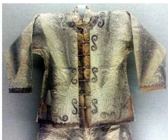
Рисунок 6. Шуба из рыбьей кожи 5

Изделия из рыбьей кожи далеко не необычный виток в сфере развития ремесел жителей Арктики (Рисунок 6). Кропотливый процесс, включающий в себя несколько этапов подготовки самого материала, занимает длительный промежуток времени и колоссальное количество сил, упорства. Зато сами изделия получаются прочными и устойчивыми к влаге. Эскимосы пытаются восстановить ремесло, да бы не потерять региональную идентичность.