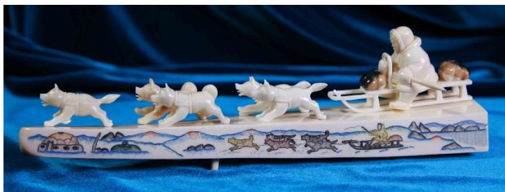
Рисунок 3. Гравированные и рельефные изображения на моржовых клыках 4

Народы Севера также практикуют изящное бисероплетение. Богато украсить одежду, для них не составляет труда. Выложенные орнаменты являются не только элементом народного костюма, но и используются в качестве налобных, поясным и нагрудных украшений, ими вышивают шкатулки и ковры. Безусловно, возникает вопрос, откуда данный материал появился в условиях крайнего Севера? Многие этнографы писали о том, что бисер являлся привозным продуктом купцов, решившихся через глыбы снега осуществлять продажу пушнины. Маленькие, но безумно красивые крупинки высоко ценились, лишь за несколько штук могли отдать оленя.