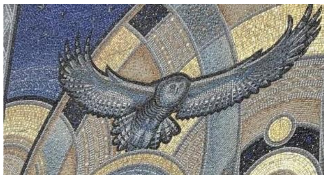
Рисунок 3. Фрагмент мозаичного панно из смальты «Солнце Арктики» в городе Норильск (Полярная сова) 3