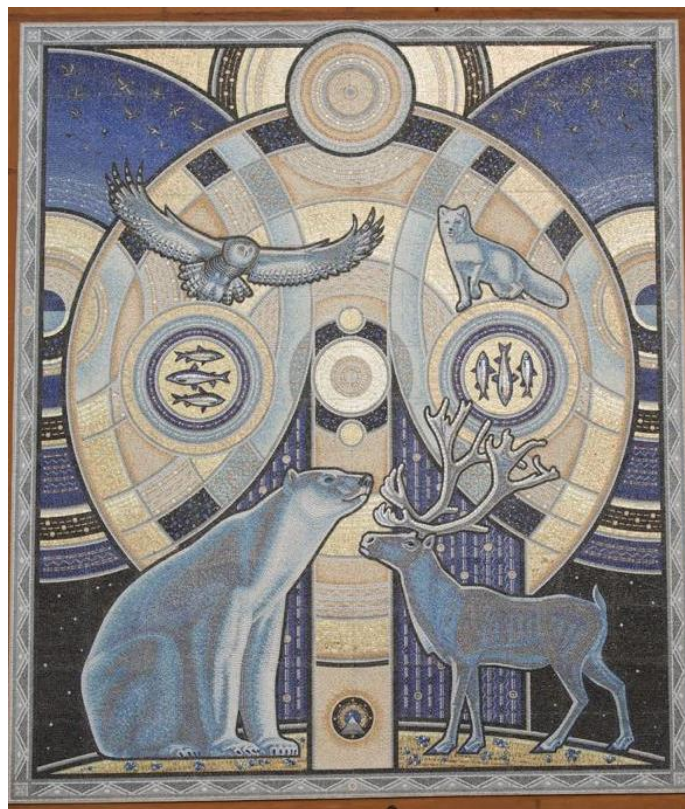
Рисунок 1. Общий вид мозаичного панно из смальты «Солнце Арктики» в городе Норильск 1

Открытие монументально-декоративной мозаики, которую сделали современные мастера стало историческим моментом для Норильска. Это произведение символизирует реновацию, развитие и обновление города, сплоченное единение всех районов, богатство природы и преемственность поколений.