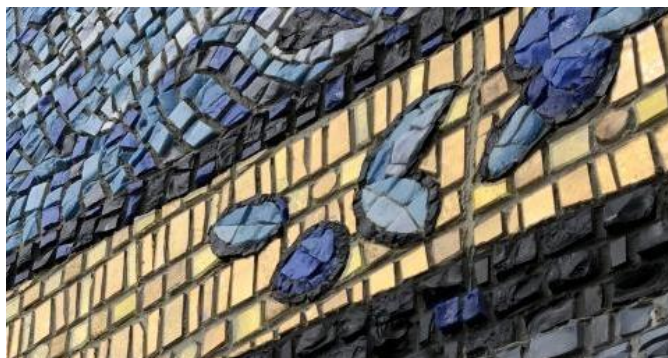
Рисунок 6. Фрагмент панно «Солнце Арктики» (использование золотой смальты) 5

Стремительное развитие современных технологий являются причиной изменения принципов проектирования монументально-декоративной композиции в архитектурном пространстве городской среды и базируется на критериях восприятия большого количества информации и потребностей как индивида, так и в общей сложности общества.