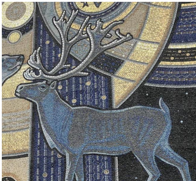
Рисунок 2. Фрагмент мозаичного панно из смальты «Солнце Арктики» в городе Норильск (Олень) 2

Римская мозаика с использованием смальты с драгоценными металлами – не распространена в общественных пространствах, так является более дорогостоящей. Наиболее часто использовалась такая смальта в оформлении сакральных пространств.