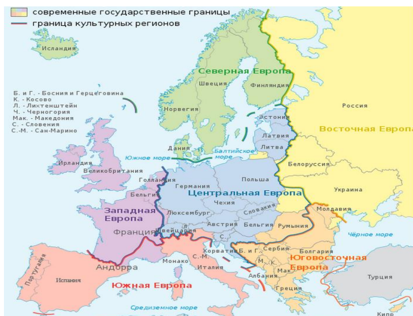
Рисунок 1. Культурные регионы Европы в начале XXI века

В состав Европы административно включены некоторые трансконтинентальные государства: Россия, Грузия, Азербайджан, Армения, Кипр и Дания. Турцию и Казахстан по своему геополитическому положению и влиянию традиционно относят к Азии, хотя эти страны и имеют трансконтинентальное влияние на Европу из-за своего пограничного положения.